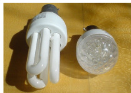
Fig.9.4: Philips 11W neben Omicron 1,3W LED