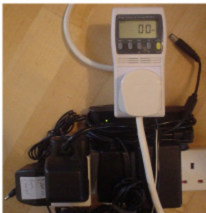
Fig.11.2: Diese fünf Ladegeräte – drei für Handys, eines für einen Handheld PC, eines für einen Laptop – zeigten weniger als ein Watt auf meinem Messgerät.