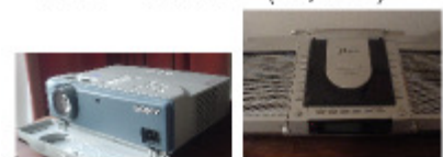
Projector: 150W Digital radio: 8W