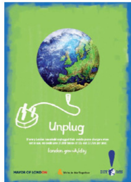
Fig.11.6: Werbung für die „DIY planet repairs“ Kampagne. Der Text bedeutet: „Ausstecken. Wenn jeder Londoner Haushalt seine unbenutzten Ladegeräte aussteckte, könnten wir 31.000 Tonnen CO 2 und 7,75 Mio £ pro Jahr sparen“ london.gov.uk/diy/