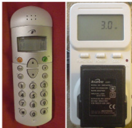
Fig.11.3: Dieses verschwenderische kabellose Telefon und sein Ladegerät brauchen 3 W wenn sie eingesteckt bleiben. Das sind 0,07 kWh/d. Bei Stromkosten von 10 Cent pro kWh kostete das 3W-Tröpfeln 3€ pro Jahr.

OK, genug der Titanic-Rettung mit der Teetasse. Schauen wir, wo elektrischer Strom wirklich verbraucht wird.