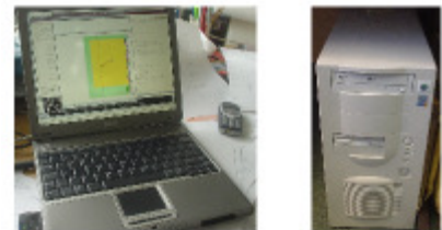
Laptop: 16W Computer: 80W